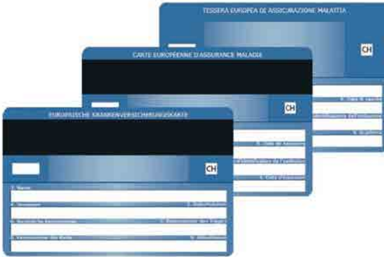
Tessera europea di assicurazione malattia