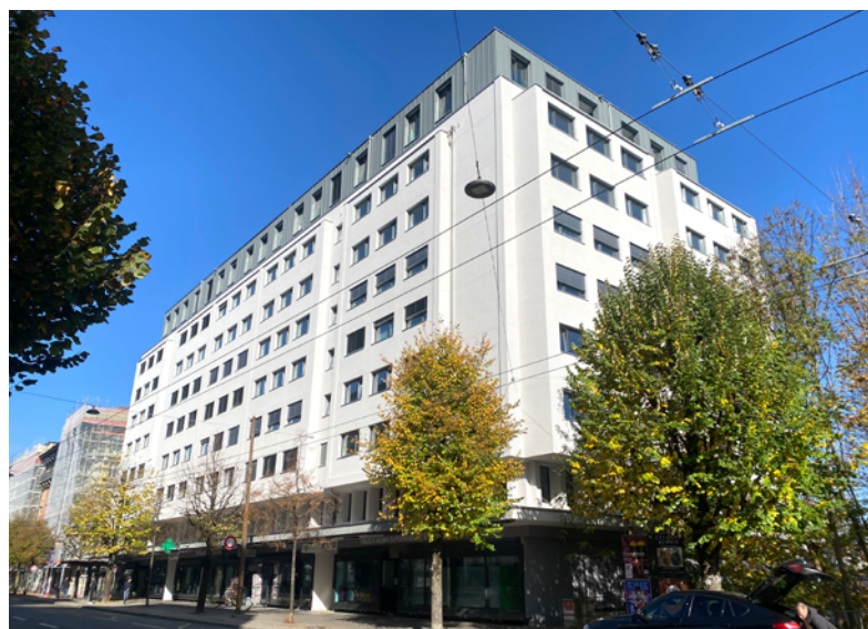
Assainissement et surélévation de l'immeuble de la CPE à Fribourg, Rue Jacques-Vogt 1-3 et Boulevard de Pérolles 32-34

C'est pourquoi la CPE renonce délibérément à cette pratique et mise sur une planification soignée et une communication étroite avec les locataires pour tous ses projets de transformation afin de réaliser ses rénovations d'immeubles de façon la plus optimale et la plus socialement acceptable possible.