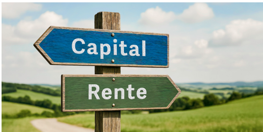
Rente ou retrait sous forme de capital – une décision qui demande réflexion

Votre caisse de pension, en revanche, vous verse une rente à vie. Certes, celle-ci est imposable et vos enfants devront gagner leur vie eux-mêmes. Vous aurez toutefois la certitude de voir votre rente arriver à temps chaque mois sur votre compte. Et à votre décès, votre épouse ou votre époux percevra également une rente garantie à vie. Auprès de la CPE, votre rente inclut en sus une rémunération de 2% par an, elle aussi garantie et à vie.